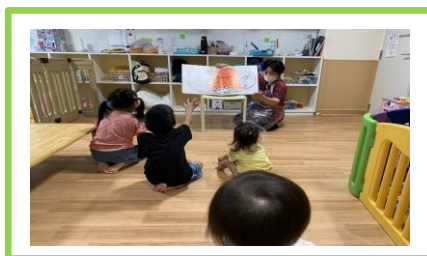
【たまごのあかちゃん】