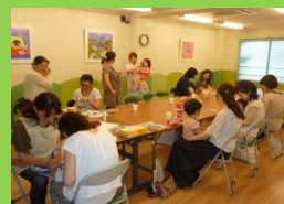
2015年6月赤ちゃんのお口の発達とケア