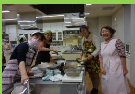
2015年2月ひなまつりクッキング