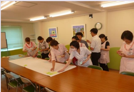
個人で考えたアイデアを付箋用紙で大きな紙に貼りました。

今後、これらのアイデアをもとに、子どもさんにとっても、家族の皆さんにとっても「入院して良かった」と思っていただける環境を考え、改善していきたいと思えます。地域の入院施設をもたない医療機関の共同利用病床だと思っていたら幸い、当院を活用していただけたら幸いです。そして、医療機関が連携することにより、地域の子育てを総合的に支援していきたいと思えます。