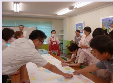
その付箋用紙を、サービス関係とか、環境整備関係などグループ分けて、これはすぐできる・コストがかかるなど整理しました。