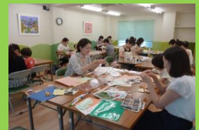
2015年7月親子スクラップブック