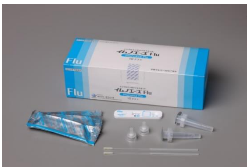
インフルエンザ検査キット